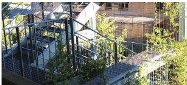
Habitat partagé « les Castors » à Saint-Étienne (ZAC Desjoux)

Vous êtes un groupe et avez un projet participatif à Saint-Étienne ?