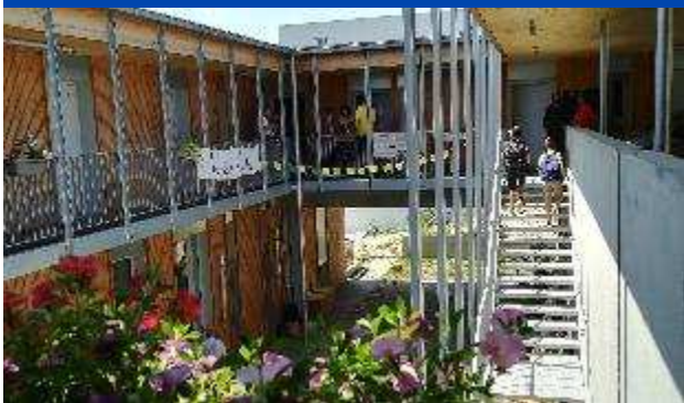
Habitat partagé « La Semblada » à Clermont-Ferrand

L'habitat participatif se développe partout en France. Les projets sont appréciés et portés autant par les acteurs institutionnels que par les usagers. L'EPA Saint-Étienne, qui dispose de terrains pouvant potentiellement accueillir des projets participatifs, s'est doté de moyens pour accompagner des groupes qui souhaiteraient porter un projet à Saint-Étienne.