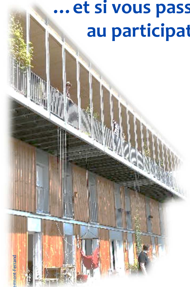
Habitat partagé « La Semblada » à Clermont-Ferrand

... et si vous passiez au participatif ?